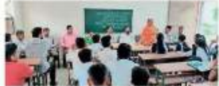
समाज म्हणजे एकत्र येणे. समाजाच्या दोन्ही बाजूंना समान संधी देणे गरजेचे आहे. पुरुषांच्या सोबतच महिलांचा समाजही एकत्र येऊनच समाज चालू शकतो.