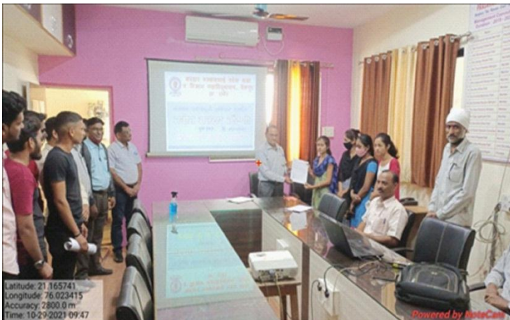
Distribution of registration form

To involve the youth in the voting process and educate them about EPIC card, college has arranged the campaign for distribution of voter registration form on 02/05/2021